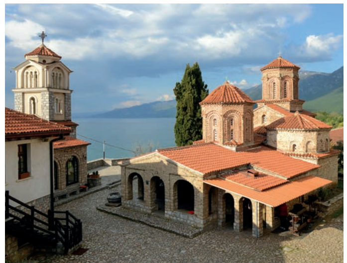
Kloster St. Naum

Für die Einreise nach Nordmazedonien ist für deutsche Staatsbürger ein Personalausweis erforderlich, der ab dem Ausreisetag noch mindestens sechs Monate gültig sein muss.