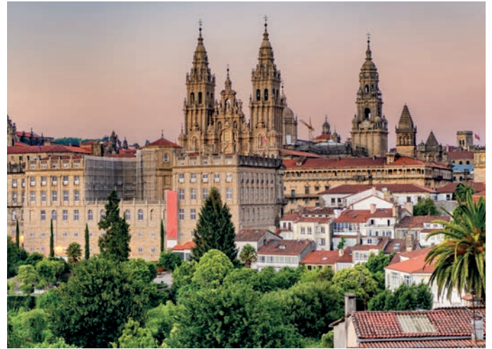
Santiago de Compostela