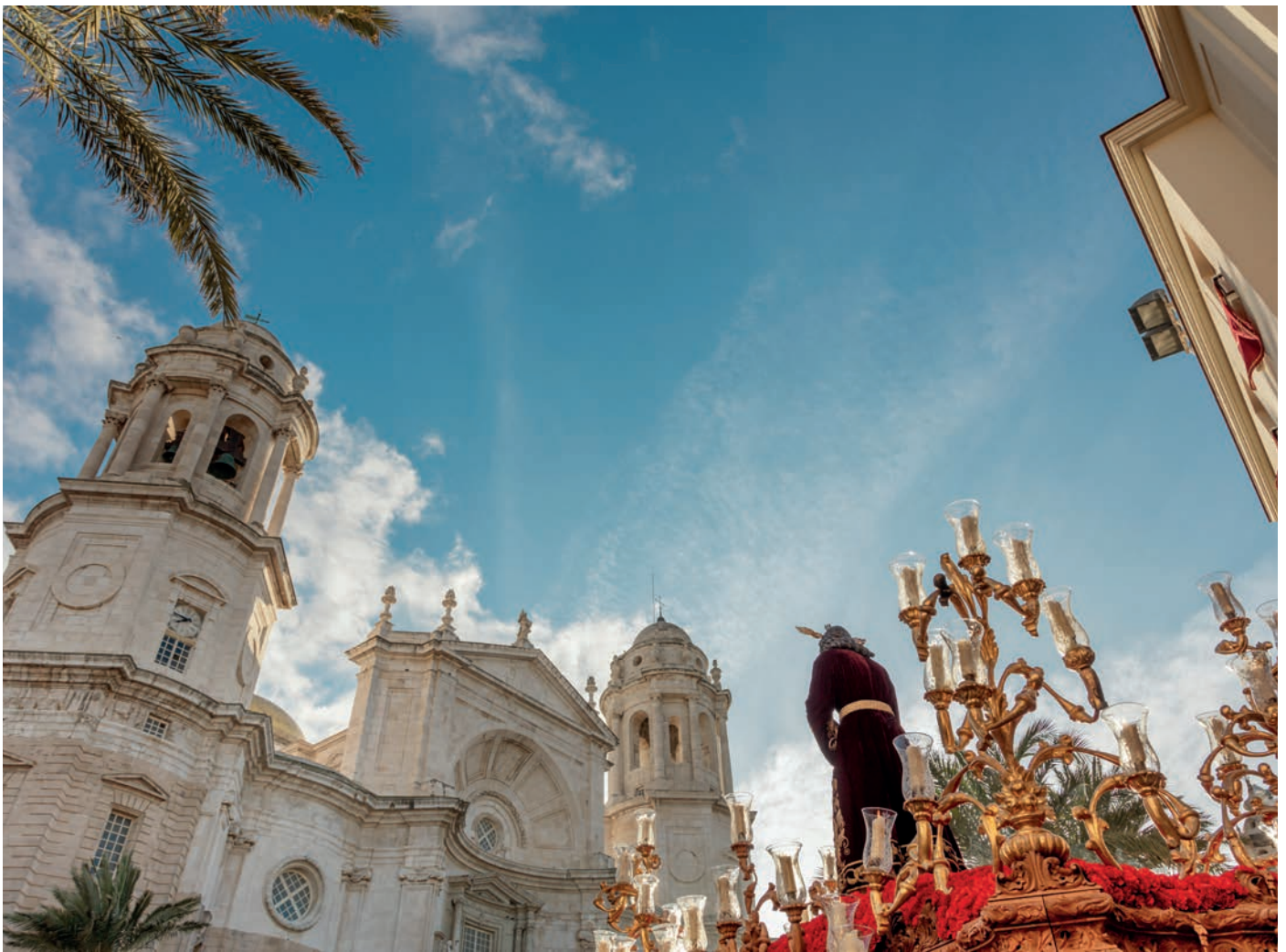
Semana Santa in Cádiz