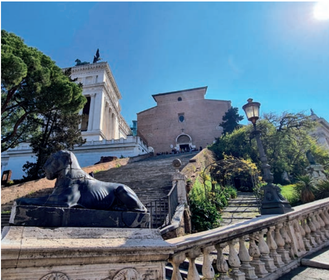
Aufgang zum Capitol

[18.09.2024] Sie beginnen Ihre Besichtigungen heute am Circus Maximus. Auf der 500 m langen Rennbahn fanden zur Römerzeit Wagenrennen mit Zwei-, Drei- und Viergespannen statt. Ein Spaziergang führt Sie vorbei am Theater des Marcellus zum Kapitol. Von dort können Sie die Pracht des Forum Romanum bewundern. Der Nachmittag steht Ihnen nochmal für eigene Erkundungen zur freien Verfügung, bevor Sie sich zu einem festlichen Abschiedsessen in der Altstadt treffen.