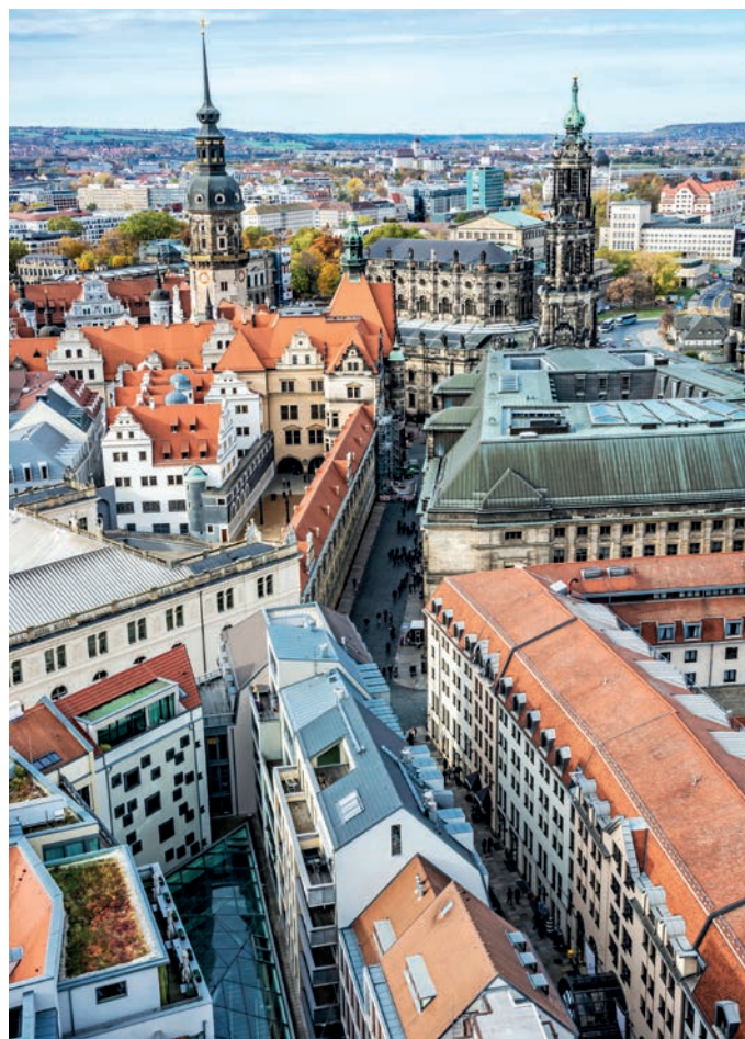
Frauenkirche und Residenzschloss