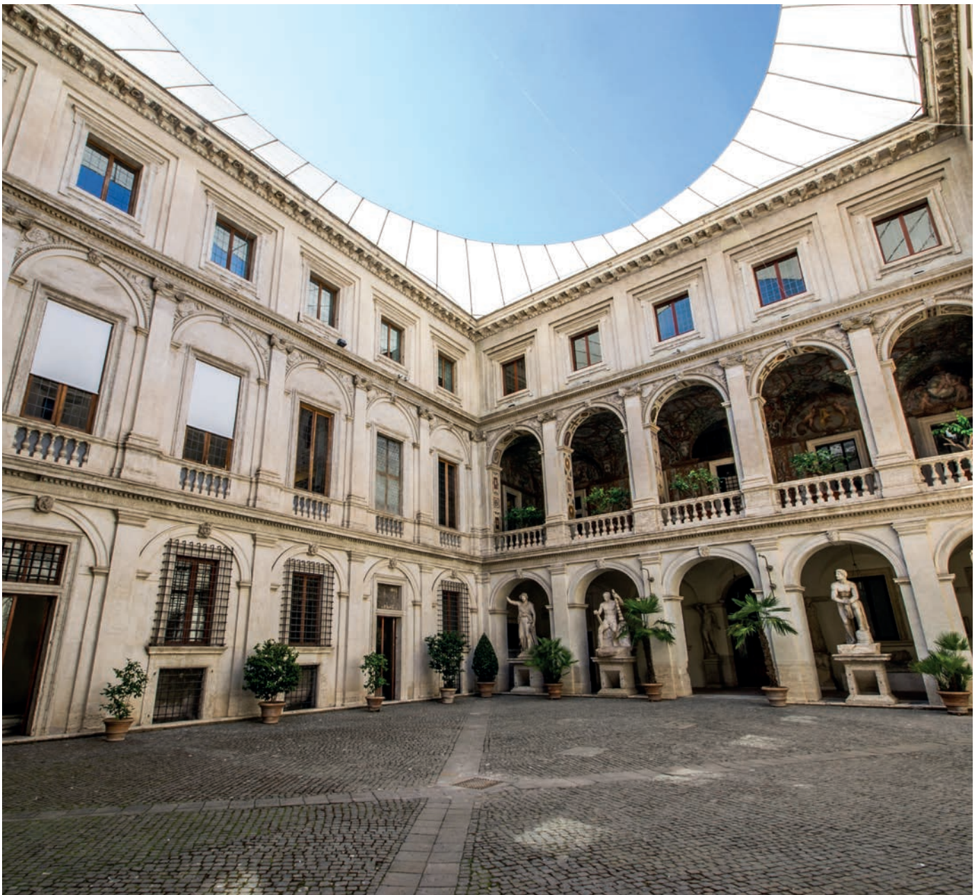
Palazzo Massimo alle Terme