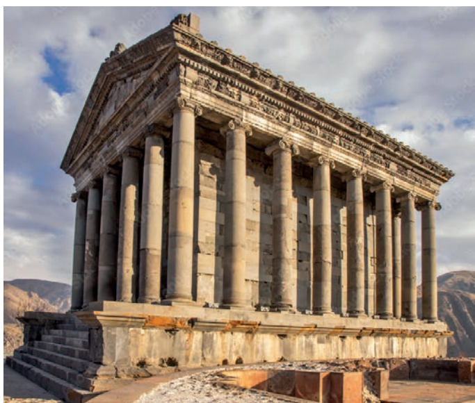
Tempel von Garni

[02.06.2024] Besuch der weltweit größten Handschriften-sammlung Matenadaran. Fahrt zum Tempel von Garni (1. Jahrhundert n. Chr.), dem einzigen hellenistischen Tempel im Kaukasus. Er besteht aus 24 Säulen, die die 24 Stunden des Tages symbolisieren. Auf einem Bauernhof werden Sie bei der Zubereitung des Fladenbrotes Lavash zuschauen können und das warme Brot beim Mittagessen im Gartenrestaurant probieren. Im Anschluss fahren Sie zum Felsenkloster Geghard, das zum UNESCO-Weltkulturerbe gehört. Es wird auch »Ayrivank« genannt, was »aus dem Felsen gehauene Kirche« bedeutet. Es gibt einen Mythos über die heilige Quelle in dem Kloster, nach dem das heilige Wasser jede Krankheit heilen kann, sobald Sie einen Schluck davon trinken. Chor Konzert im Kloster. Fahrt zurück nach Jerewan. Abendessen in der Unterkunft.