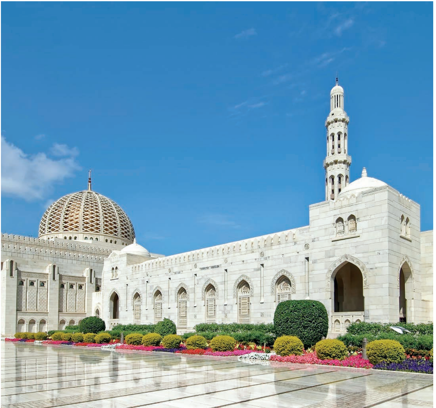
Sultan-Qabus-Moschee in Oman