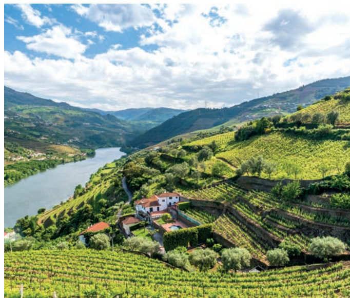
Der Fluss Duoro