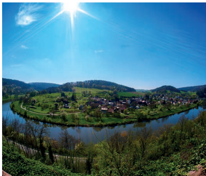
Neckarbiegung bei Neckargerach