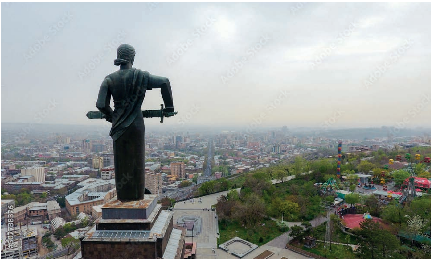
Mutter Armenien im Siegespark der armenischen Hauptstadt Jerewan

Zvartnots – ein UNESCO Weltkulturerbe und frühmittelalterliches armenisches Denkmal aus dem 7. Jahrhundert. Zum Abschluss des ersten Reisetages erwartet Sie ein traditionell armenisches Willkommensabendessen.