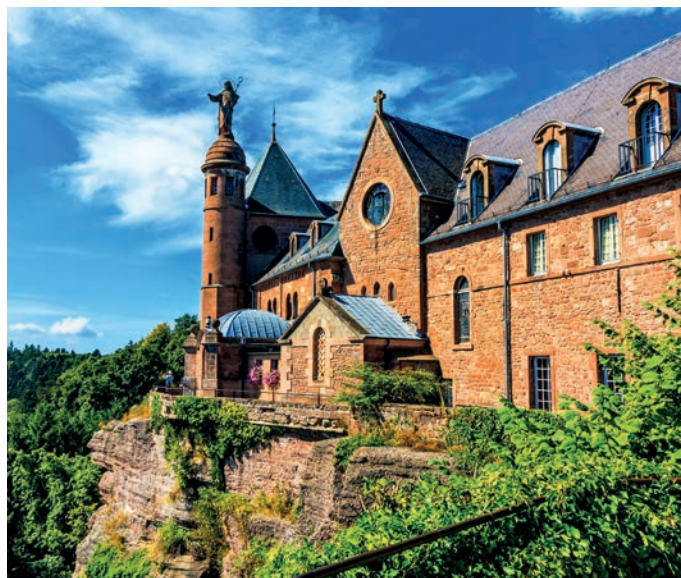
Saint Odilia Kloster