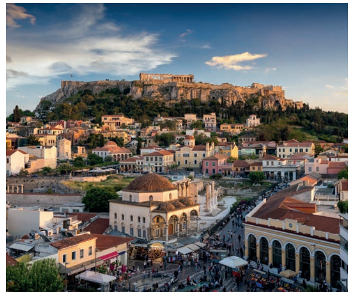
Altstadt Plaka und Akropolis von Athen