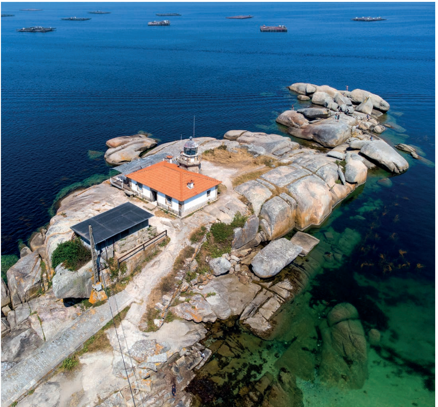
A Illa de Arousa