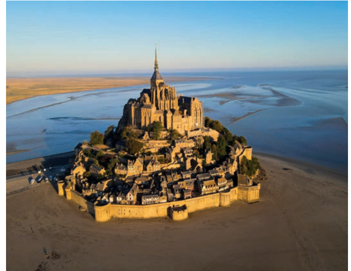
Mont St. Michel