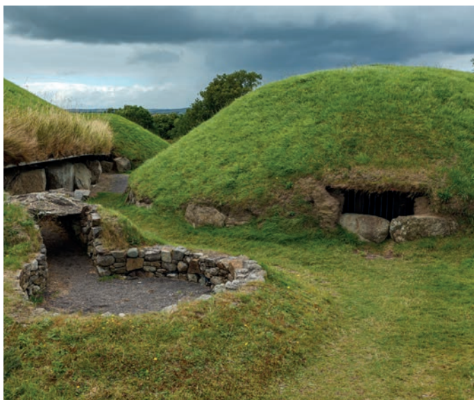
Anlagen von Newgrange

[20.08.2024] Morgens fahren Sie nach Clonmacnoise, eindrucksvoll oberhalb des Shannon gelegen. Trotz der Zerstörung durch die Engländer im Jahre 1552 gibt es dort mächtige Ruinen zu bewundern: eine Kathedrale, acht Kirchen, zwei Rundtürme, Hochkreuze und die Überreste einer Normannenburg. Anschließend besuchen Sie eine Whiskeybrennerei in Kilbeggan und erfahren alles Wichtige über die Herstellung von Whiskey, auf Irisch »uisce beatha«, was so viel wie Wasser des Lebens bedeutet. Nach der Besichtigung fahren Sie weiter nach Dublin. Sie beziehen Ihr Zimmer für eine Nacht in Dublin.