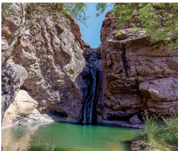
Wasserfall El Charco de la Paloma