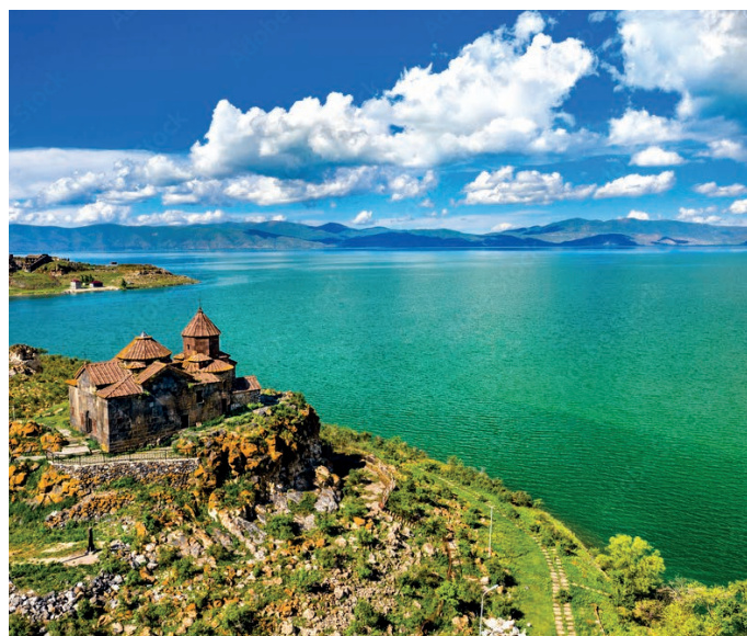
Kloster Hajrawank am westlichen Ufer des Sewanesees

Für die Einreise nach Armenien ist für deutsche Staatsbürger ein Reisepass erforderlich, der ab dem Ausreisetag noch mindestens sechs Monate gültig sein muss.