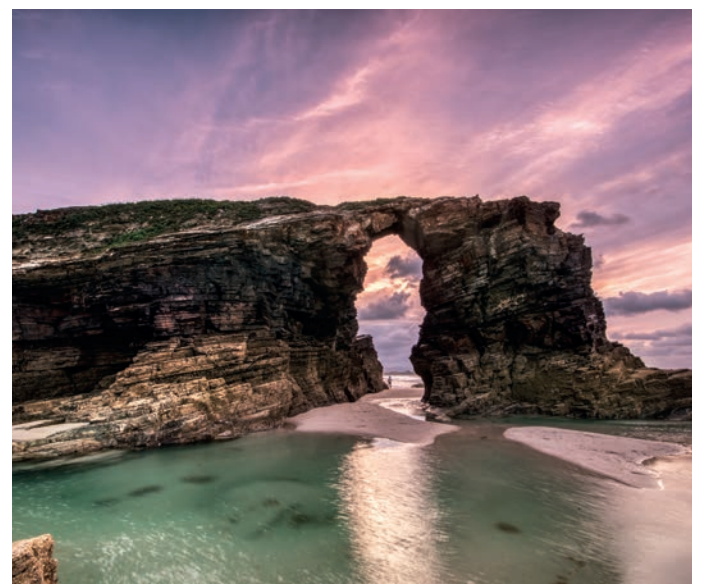
Playa de las Catedrales