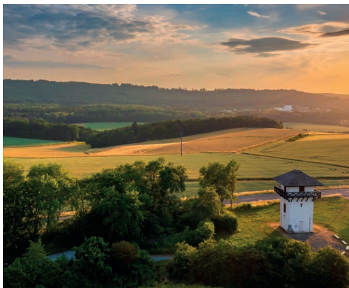
UNESCO-Welterbe Limes im Taunus