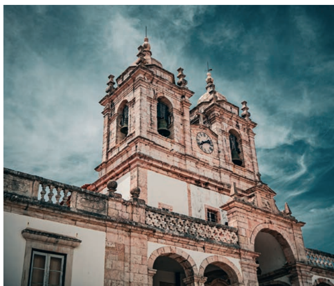
Nossa Senhora da Nazaré