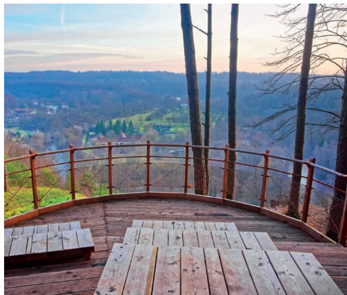
Pavilniai Regional Park