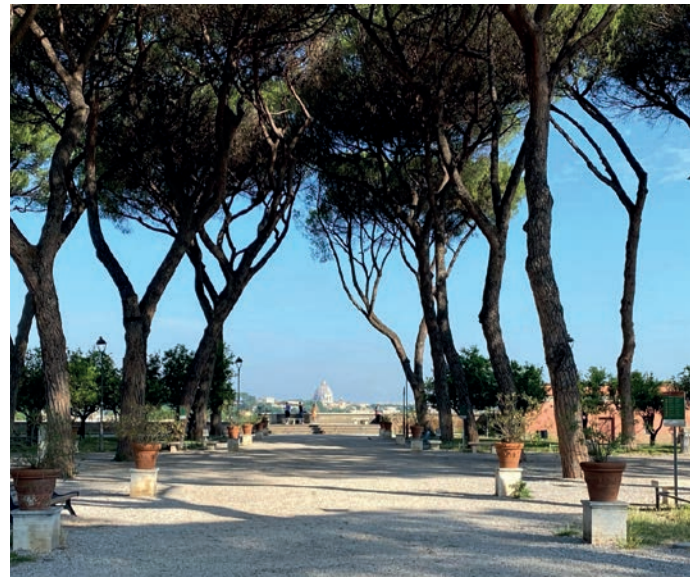
Orangengarten auf dem Aventin