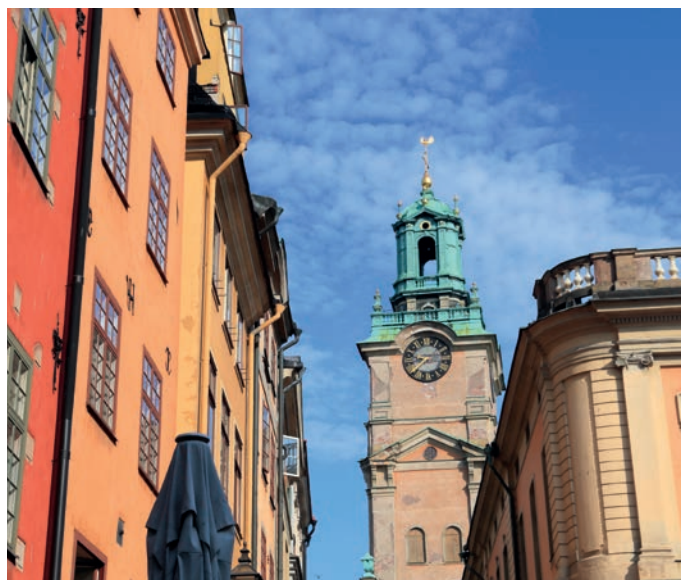
Stockholm Storkyrkan Kirche