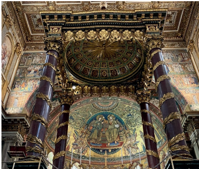
S. Maria Maggiore

[31.03.24] Der Höhepunkt Ihres Aufenthaltes in der Ewigen Stadt wird die Teilnahme an der festlichen Osterliturgie mit Papst Franziskus auf dem Petersplatz sein. Anschließend spendet der Papst den Segen »Urbi et Orbi«.