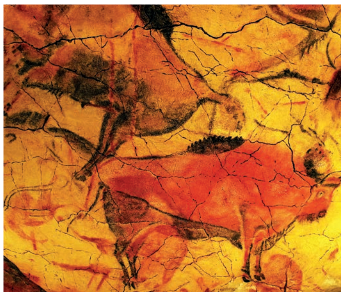
Steinzeith hle von Altamira

[11.09.2024] Wir fahren zum Monte del Gozo, dem Berg der Freude. Nach dem letzten St ck Jakobsweg erwartet uns die Besichtigung der Kathedrale und die feierliche Pilgermesse (ca. 5 km / ca. 1,5 Std. / ca. 30 Hm Auf- u. ca. 100 Hm Abstieg), (2 N chte).