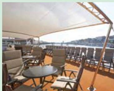
Sonnendeck mit Sonnensegel