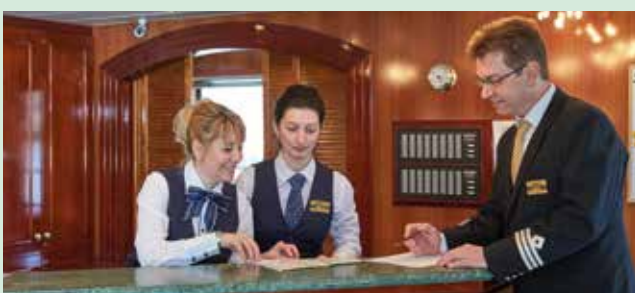
An der Rezeption