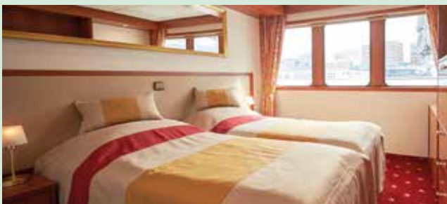
2-Bettkabine auf dem Hauptdeck