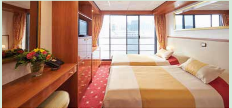
2-Bettkabine mit französischem Balkon